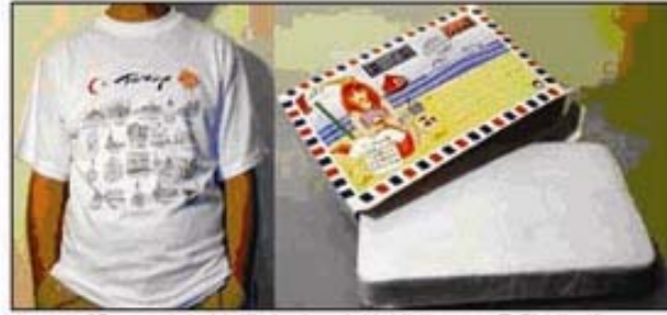
"Souvenirde bir ilk, kartpostal taklidi yapan T-Shirtler!"

Kartpostal biçiminde katlanarak sıkıştırılmış, Türkiye'nin turistik yerlerinin illüstrasyonları basılı T-Shirtler, "CardShirt™" markası ile souvenir vitrinlerinde yerini aldı. İlgi büyük!